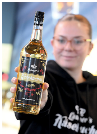
Ausgefallene Mitbringsel von der Familie & Heim – Käsekuchen aus der Flasche

Die Spielemesse ist ein Paradies für Groß und Klein. Neue Brettspiele testen, mit VR-Brille in digitale Welten abtauchen oder Roboter programmieren – hier wird gespielt, gebaut und ausprobiert.