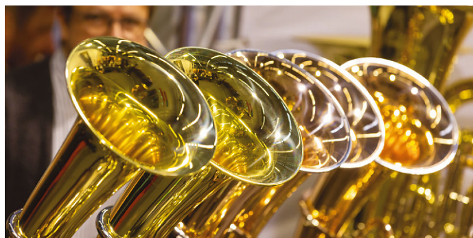
Instrumente testen auf der Blasorchestermesse BRAWO

Feinschmeckerinnen und Feinschmecker kommen bei der FOOD UND FEINES voll auf ihre Kosten. Über 100 Manufakturen präsentieren ihre Delikatessen. Live-Kochshows, Kostproben und die Sonderschau „Der gedeckte Tisch“ machen die Messe zu einem Treffpunkt für Genussmenschen.