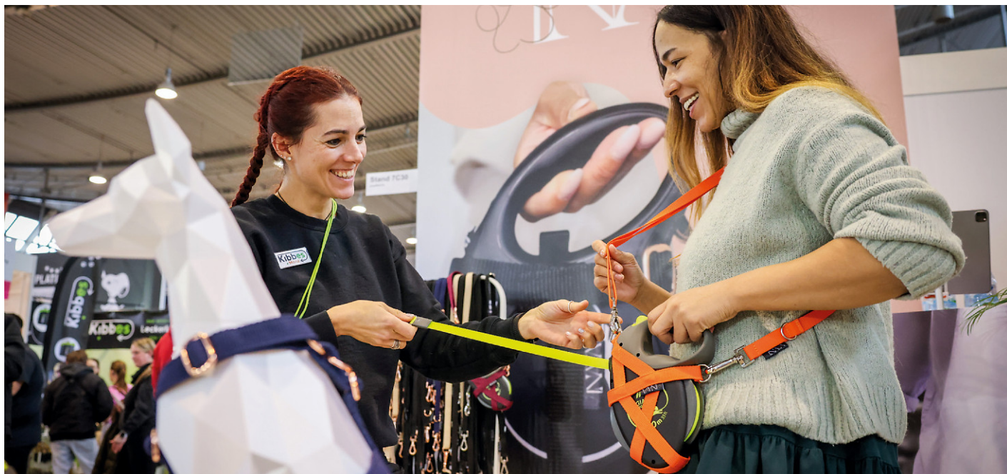
Zubehör für den vierbeinigen Liebling shoppen auf der ANIMAL