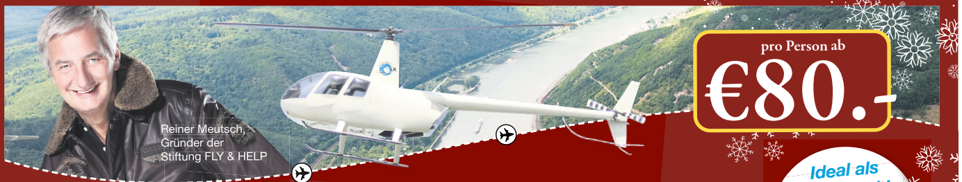
Reiner Meutsch Gründer der Stiftung FLY & HELP

www.bestattungen-hafa.de • info@bestattungen-hafa.de