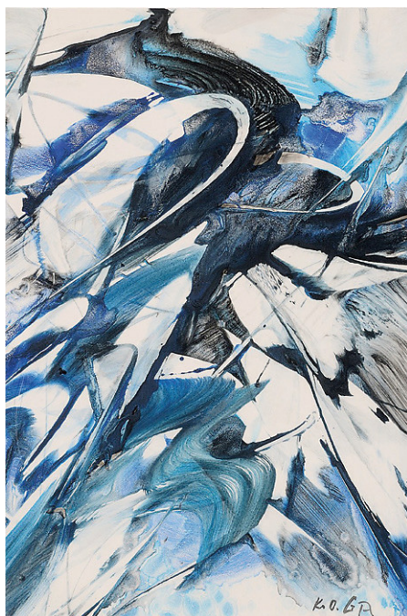
Bild: O. Götz, Kolph, 1996, Gouache auf Büttchen, 65 x 50 cm, Privatsammlung

Finden, Suchen, Bewahren, Dokumentieren und im besten Fall auch Präsentieren – das sind die klassischen Stationen und Merkmale erfolgreicher Sammeltätigkeit. Mancher begnügt sich mit einer übersichtlichen Zahl von ausgesuchten Stücken, deren Erwerb sorgfältig geplant wird, mancher sammelt exzessiv und spontan. Spezielle Kenntnisse eignen sich beide Sammlertypen an. Die einen legen Wert auf Klasse, die anderen auf Masse, wobei die Masse oft schon wieder Klasse darstellt. Nicht nur Museen sammeln, auch Privatpersonen geben sich