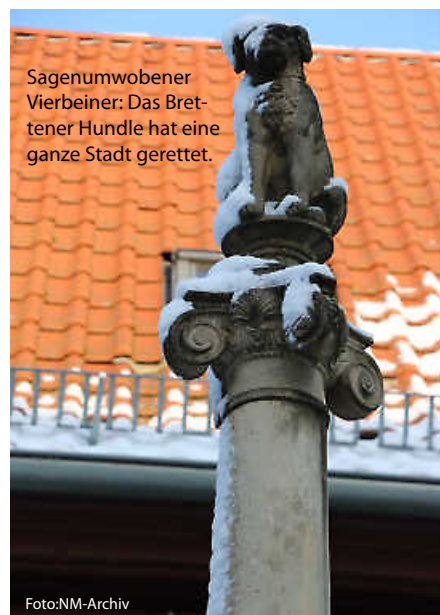
Sagenumwobener Vierbeiner: Das Brettener Hundle hat eine ganze Stadt gerettet.

Und da wäre noch die Geschichte vom Hexenbiss am Heidelberger Schloss, das älteste Musikinstrument der Welt oder auch die Antwort auf die wichtige Frage, warum Badener auch als „Gelbfüßler“ bezeichnet werden. Diese und noch viele andere spannende Anekdoten und Legenden zeigt unsere Rubrik „Unnützes Heimat-Wissen“ auf. (haf)