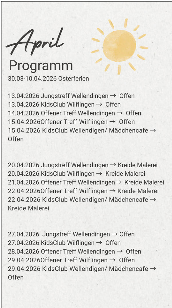
Plakate: Kinder- und Jugendbüro