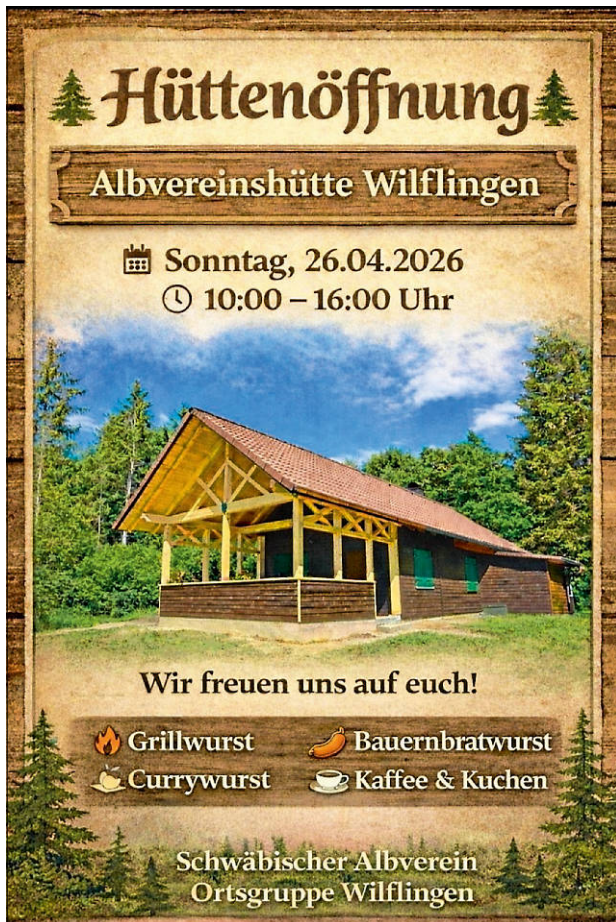
Plakat: Albverein Wilflingen

Am Sonntag, 26. April 2026 öffnet unsere Albvereinshütte ab 10.00 Uhr wieder ihre Türen und lädt euch herzlich zum Saisonstart ein. Für das leibliche Wohl ist bestens gesorgt: Freut euch auf leckere rote Wurst vom Grill, Bauernbratwurst und Currywurst . Außerdem bieten wir euch Kaffee und Kuchen an.