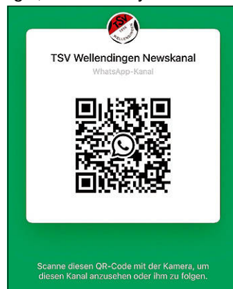
Plakat: TSV Wellendingen

Auf unserer Homepage www.tsv-wellendingen.de steht der aktuelle Bewirtungsplan zur Verfügung. Folgt uns für mehr Informationen rund um unseren Verein auf Instagram oder unserm WhatsApp-Kanal