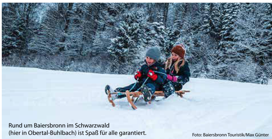
Rund um Baiersbronn im Schwarzwald (hier in Obertal-Buhlbach) ist Spaß für alle garantiert.

... gibt es die Hänge am Feldberg, Kandel oder rund um Todtnau. Hier wird es steil, schnell und aufregend. Größere Kinder werden diese Hänge lieben – vorausgesetzt, Eltern haben starke Nerven und den Kids gute Bremstechnik beigebracht. (jr/red)