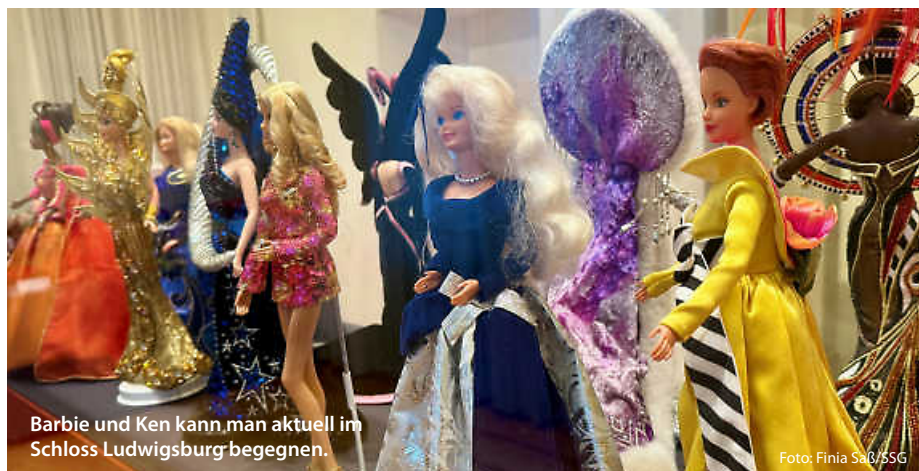
Barbie und Ken kann man aktuell im Schloss Ludwigsburg begegnen.

Jedes Museum bietet nicht nur Spaß für Kids, sondern sorgt auch bei den Älteren für eine kleine Atempause mit dem Gefühl: Hier wird unser Alltag erleichtert. Und das Beste? Viele dieser Einrichtungen haben familienfreundliche Eintrittspreise. Perfekt für einen vollen Tag – ohne, dass am Abend der Geldbeutel stöhnt. Fertig sind 10 Abenteuer, die Lust machen, neue Welten zu entdecken. Also: Wer packt den Rucksack? (ral/jr/red)