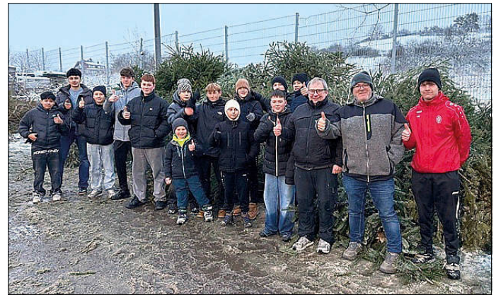
C-Jugend der SGM

Die C-Jugend der SGM Wellendingen bedankt sich recht herzlich bei allen Bürgerinnen und Bürgern für die zahlreichen Spenden im Rahmen der Weihnachtsbaumsammelaktion am vergangenen Samstag. Dank Ihrer Unterstützung konnte die Aktion erfolgreich durchgeführt werden. Die Einnahmen kommen vollständig der Jugendarbeit zugute. Vielen Dank für Ihre Hilfe und Ihr Engagement.