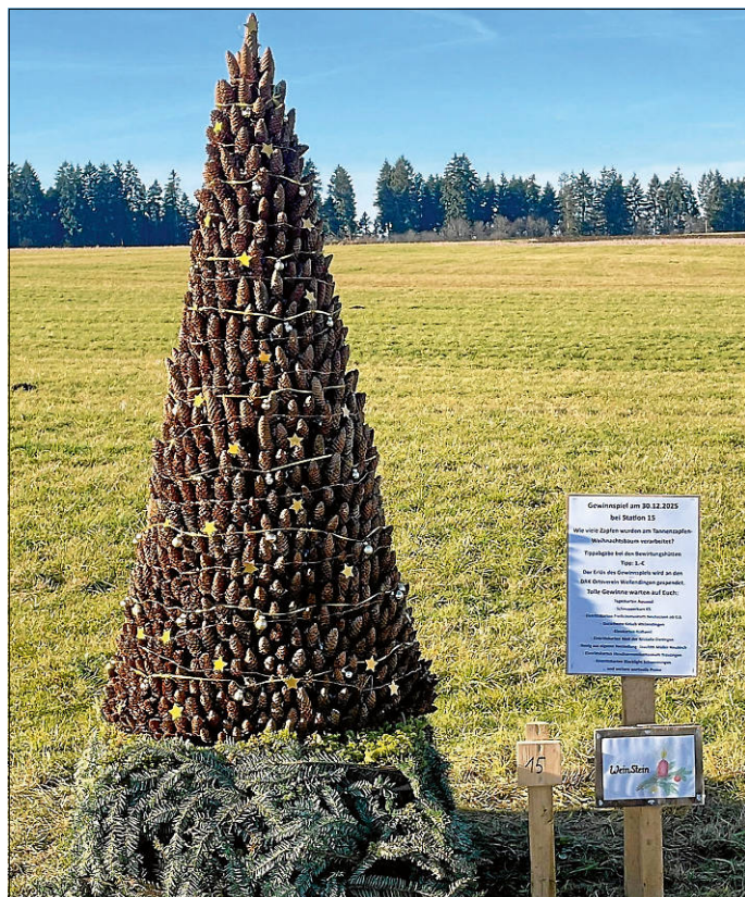
Station „WeinStein“ auf dem Adventsweg