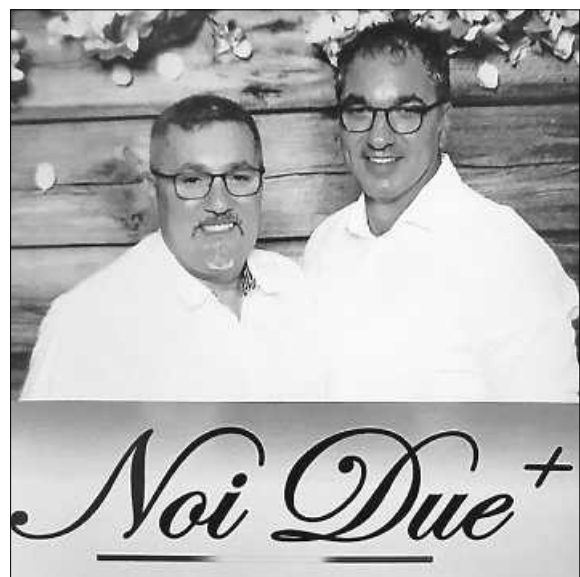
Livemusikband „Noi Due+“