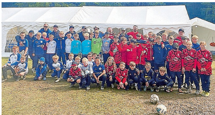
Klippeneck-Zeltlager D-Jgd. 2025

Neben den sportlichen Highlights gab es viele schöne Momente. Beim Turnier, Fußballtennis, Lagerfeuer oder beim gemeinsamen Filmabend – der Spaß kam trotz des Wetters nie zu kurz. Und alle Kinder konnten stolz ihr „Seepferdchenabzeichen Klippeneck 2025“ mit nach Hause nehmen! Ein großes Dankeschön geht an den FSV Denkingen für die großartige Organisation, vor allem bei den schwierigen Wetterbedingungen. Wir freuen uns schon auf das nächste Jahr – mit hoffentlich mehr Sonnenschein und noch mehr Erfolgserlebnissen!