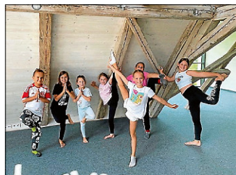
Teilnehmer Kinderyoga

Am 1. August 2025 fand im Rahmen des Sommerferienprogramms im Bürgerhaus (Mediathek) eine ganz besondere Kinderyoga-Stunde statt. Unter dem Motto „Reise mit dem Yoga-Motorrad durch den Zoo“ begaben sich die kleinen Teilnehmerinnen und Teilnehmer auf eine fantasievolle und bewegte Reise.