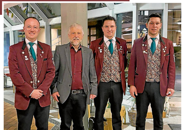
Scheckübergabe an den Geschäftsführer der Katharinenhöhe

Musik hat die Kraft, Brücken zu bauen und Herzen zu öffnen.