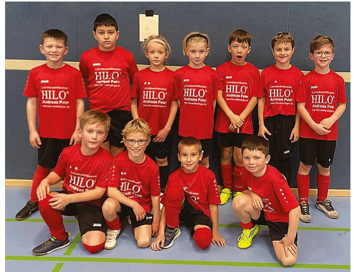
F-Junioren in Trossingen

Wir freuen uns auf einen tollen Heimspieltag und viele spannende Spiele!