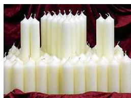
Kirchengemeinde St. Gallus Wilflingen

Wir feiern am Samstag, 31. Januar 2026, um 18.30 Uhr in unserer Kirche Mariä Lichtmess. In diesem Gottesdienst werden die Kerzen gesegnet und den Blasiussegen gesendet.