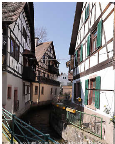
Fachwerkidyll am Ufer der Rench. In Oberkirch ist Heimatgefühl quasi vorprogrammiert.

Und dazwischen? Hier haben die Veranstalter gemeinsam mit einer Vielzahl von lokalen Akteuren, von Winzergenossenschaft bis zum Sportverein, dafür gesorgt, dass kein Wunsch offenbleibt. Von der Weinwanderung bis zur Vogelexkursion: Hier kann man Heimat das gesamte Jahr über erleben, entdecken und genießen. (jr)