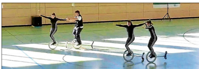
Kleingruppe Expert „3 Engel für Charlie“