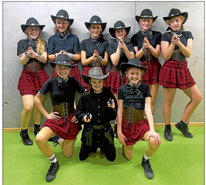
„Im Wilden Westen“

Es war ein rundum erfolgreicher und wunderschöner Wettkampftag, auf den wir mit großer Freude zurückblicken. Wir sind sehr stolz auf die Leistungen unserer Sportlerinnen, freuen uns bereits auf die nächste Meisterschaft: die Baden-Württembergische Meisterschaft vom 03.07.2026-05.07.2026 in Appenweier. Dafür wünschen wir unseren Sportlerinnen weiterhin viel Erfolg, Freude und tolle Ergebnisse.