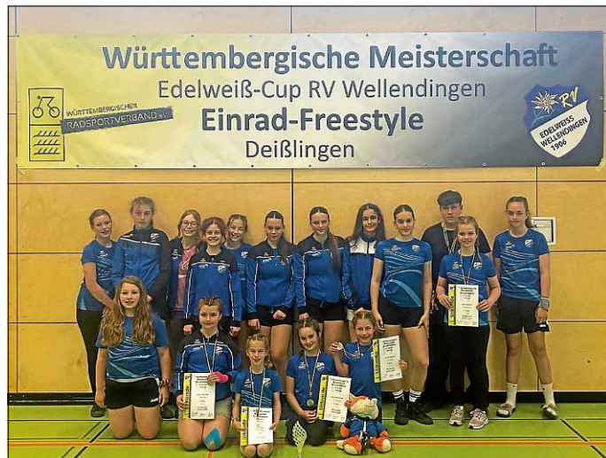
Württembergische Meisterschaft mit Edelweiß-Cup

Starke Kürren, große Emotionen und ein rundum gelungener Wettkampftag in Deißlingen