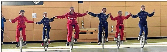
Kleingruppe Expert „We are the competition“

Kleingruppe Jun. Expert (6 Fahrer): Platz 2 Kleingruppe Expert (4 Fahrer): Platz 3 Großgruppe Expert (10 Fahrer): Platz 2 Wir gratulieren allen Fahrern zu ihren Platzierungen.