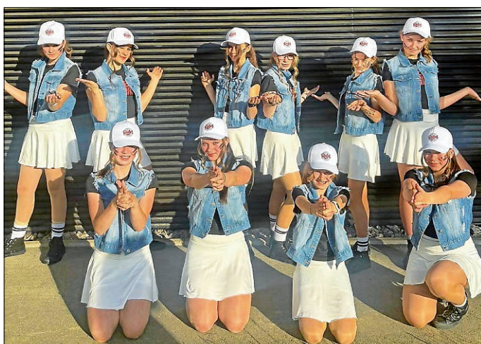
Großgruppe Expert „Rebellen“

Rund 150 Zuschauer verfolgten den Wettkampf gespannt und sorgten für tolle Stimmung in der Halle. Ein besonderer Dank gilt allen Helfern, die mit großem Einsatz zum Gelingen der Veranstaltung beigetragen haben – ob beim Auf- und Abbau, in der Küche, in der Jury oder hinter den Kulissen. Der RV Wellendingen blickt stolz auf die gezeigten Leistungen seiner Fahrer und freut sich bereits auf die kommenden Wettkämpfe – besonders auf die Baden-Württembergische Meisterschaft Anfang Juli in Appenweiler.